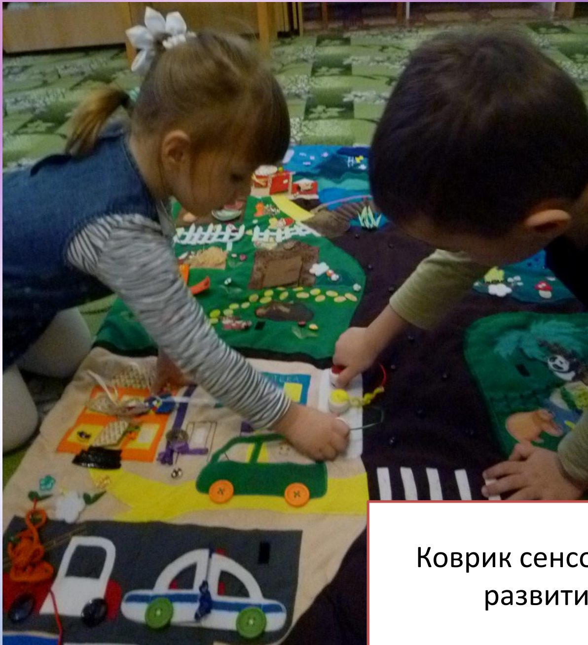
Коврик сенсорного развития