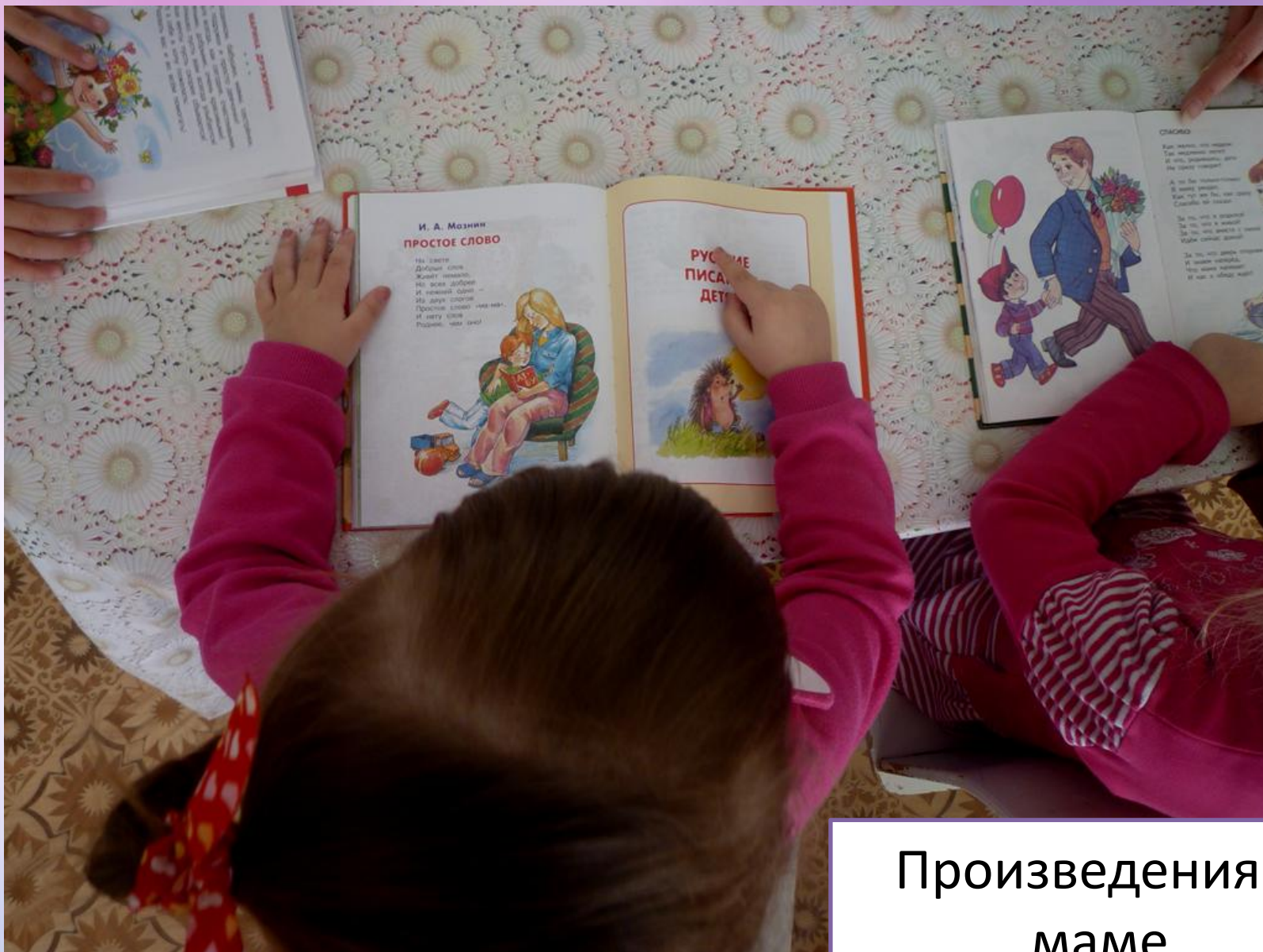
Произведения о маме