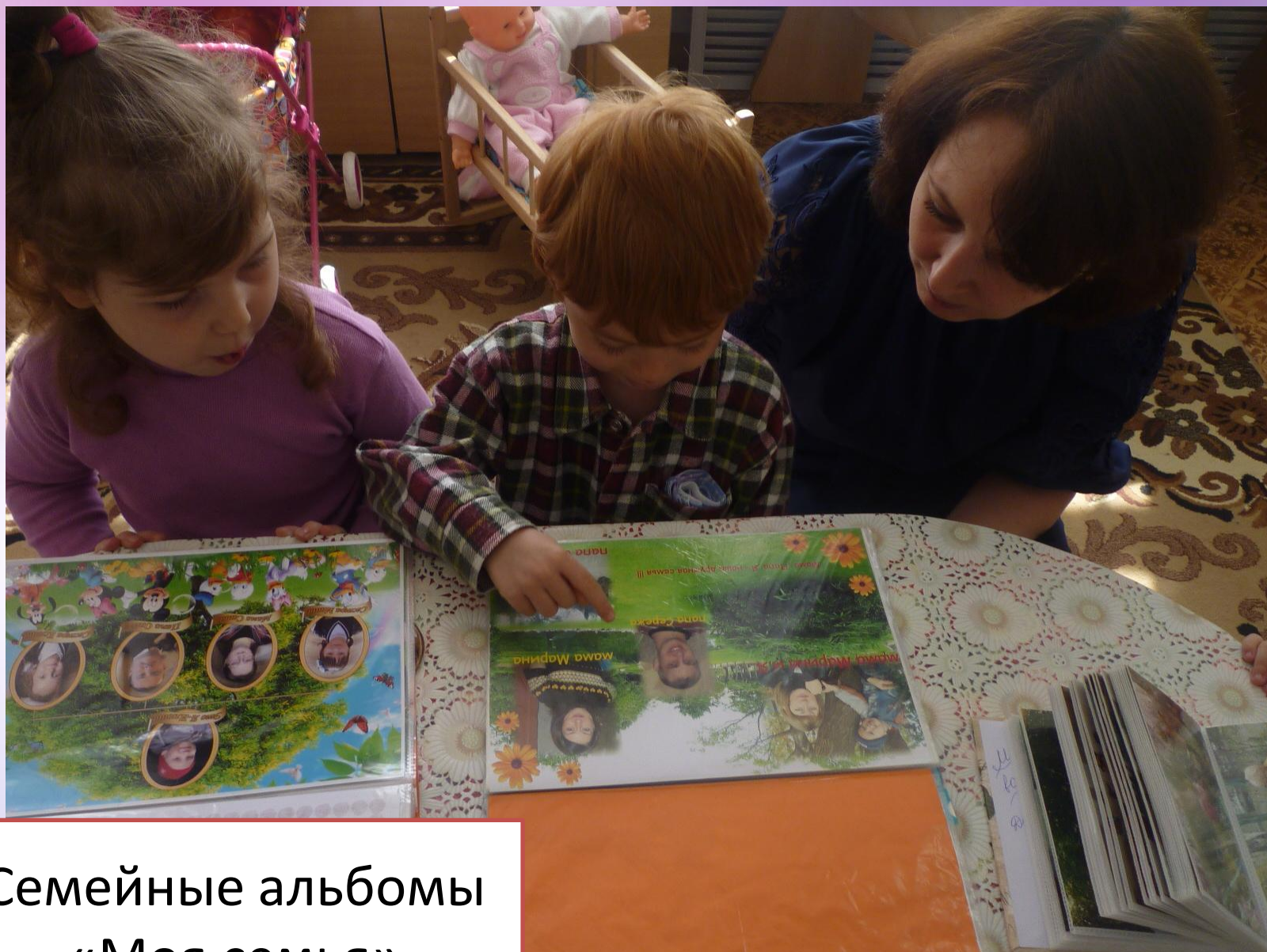
Семейные альбомы «Моя семья»